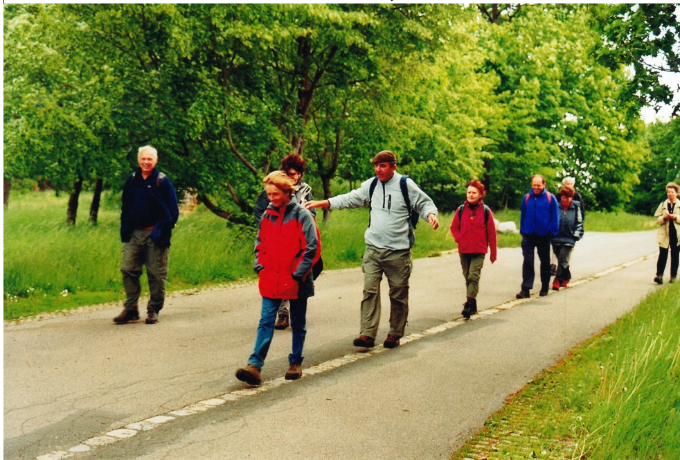
FAV-Wanderer auf dem 50. Breitengrad, Nähe Zapfendorf